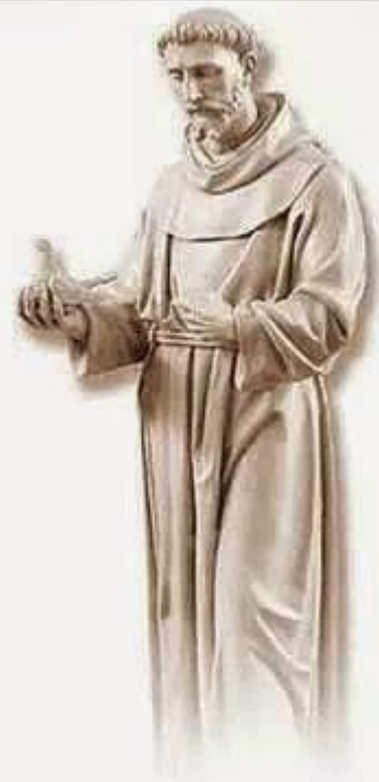
San Francisco de Asís

Señor, haz de mí un instrumento de tu paz: donde haya odio, ponga yo amor, donde haya ofensa, ponga yo perdón, donde haya discordia, ponga yo unión, donde haya error, ponga yo verdad, donde haya duda, ponga yo la fe, donde haya desesperación, ponga yo esperanza, donde haya tinieblas, ponga yo luz, donde haya tristeza, ponga yo alegría. Oh Maestro, que no busque yo tanto ser consolado como consolar, ser comprendido como comprender, ser amado como amar. Porque dando se recibe, olvidando se encuentra, perdonando se es perdonado, y muriendo se resucita a la vida eterna.